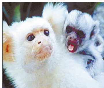
Cena de 'Gremilins na Floresta', um dos filmes do ciclo

O público presente à 51ª Reunião Anual da Sociedade Brasileira para o Progresso da Ciência, reunido na PUC, em Porto Alegre, desde ontem, terá a oportunidade de assistir ao projeto "Ver Ciência 99", realizado pelo Centro Cultural Banco do Brasil. Trata-se de uma mostra anual dos melhores programas e séries de divulgação científica. No auditório da Famecos (Prédio 7) serão exibidos, a partir de hoje e até sexta-feira, 21 filmes de 19 países. Entre os títulos anunciados está "Os Gremilins da Floresta" (Inglaterra), que será exibido na quarta-feira, às 17h.