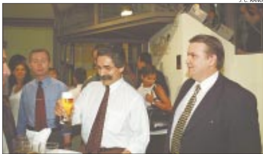
O governador ergueu um brinde ao restaurante-escola que foi entregue à cidade

O novo Chalé, com 313 lugares, distribuídos em 76 mesas, funcionará de segundas-feiras a sábados, sempre das 11h às 24h. O serviço inclui bufê, ao meio-dia; café com doces e salgadinhos, à tarde; e, a partir das 17h30min, happy hour com chope e acompanhamentos como bolinhos de bacalhau, coaçãozinho e aipim frito. À noite, o serviço será à la carte.