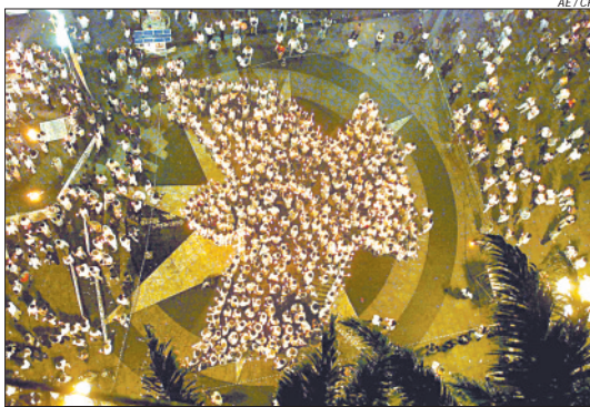
'A Paz' é o tema do VII Concurso de Crônicas Cipel - Correio do Povo

O Santander Cultural, em parceria com a Prefeitura Municipal e a Asso-