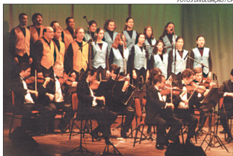
Orquestra Unisinos é uma das responsáveis pela realização do evento