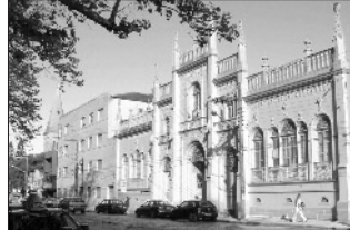
Imóvel é considerado de relevância cultural