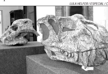
Em primeiro plano, o crânio de um Karamuru vorax