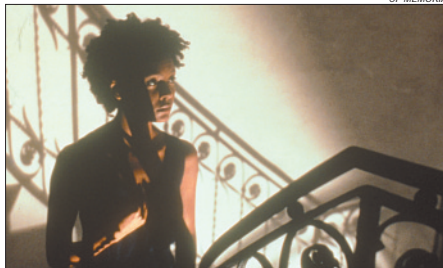
Cena de 'Assédio': beleza e tristeza estão presentes na película

Diretor premiado e com a capacidade de transportar para a tela intrigantes relações amorosas, Bertolucci ganhou aclamação mundial com "O último tango em Paris" (1972). Levam também sua assinatura "Beleza roubada" (1996), "O pequeno Buda" (1993), "O céu que nos protege" (1990) e "O último imperador" (1987), entre outros. Recebeu duas indicações ao Oscar de Melhor Diretor por "O último tango..." (1972) e "O último imperador" (1987).