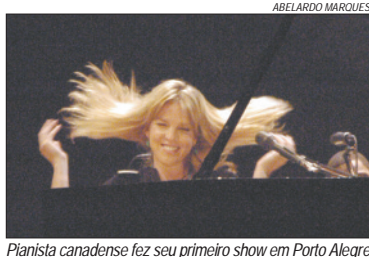
Pianista canadense fez seu primeiro show em Porto Alegre