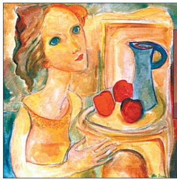
A figura de meninas se tornou marca da obra da artista

As artes plásticas do Rio Grande do Sul estão de luto. A artista plástica Alice Soares morreu ontem, vítima de embolia pulmonar e parada cardíaca no Hospital Moínhos de Vento. Nascida em Uruçuana em 17 de julho de 1917, foi uma das