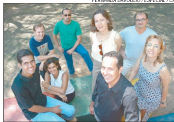
Autores do livro 'Fatais' autografam hoje na CCMQ

uma história de sangue, jornal e cinema" (editora Libretos). O livro apresenta, em forma de romance, o desastroso assalto ocorrido na Rua da Praia, em setembro de 1911, feito por quatro imigrantes russos, com direito a perseguição policial e de populares e se tornou alvo de disputa entre os jornais da época.