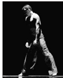
Coreografia de jazz no palco

Ganhadora de vários prêmios em festivais e mostras, a Companhia tem coreografias de Aldo Gonçalves e conta com um corpo de nove bailarinos. Somente este ano, a Cia conquistou, no Porto Alegre em Dança, os primeiros lugares na categoria de jazz adulto grupo, jazz adulto duo; jazz adulto solo masculino e bailarino destaque.