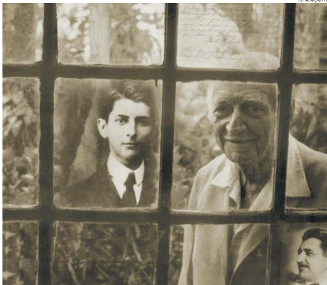
Gilberto Freyre e Ariano Suassuna são homenageados no Santander Cultural

Simultaneamente ocorre a mostra-homenagem ao dramaturgo e atual secretário especial de Cultura do Estado de Pernambuco, Ariano Suassuna, que revela o lado de artista gráfico do autor. São 29 desenhos, dez iluminogravuras, dez xilogravuras e 104 ferros de marcar boi, que apresentam o cerne do Movimento Armorial, criado por Ariano na década de 70. Criada na Idade Média por monges cristãos, a "iluminura" era usada para decorar livros. Aos 81 anos, Suassuna ocupa a cadeira número 32 da Academia Brasileira de Letras.