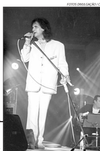
Roberto Carlos em shows na Capital

Convenção — CV: Couvert; CS: Consumação; GR: Gratuito; ING: Ingresso; EST: Estacionamento