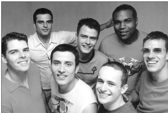
Se Ativa estará neste sábado no palco do Camarim, em Montenegro