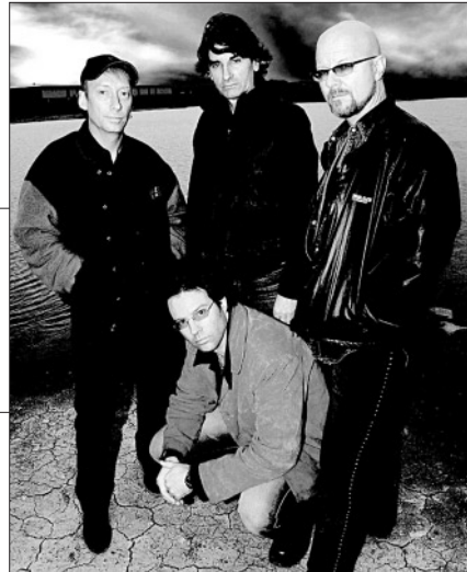
O Wishbone Ash faz show neste domingo no Opinião