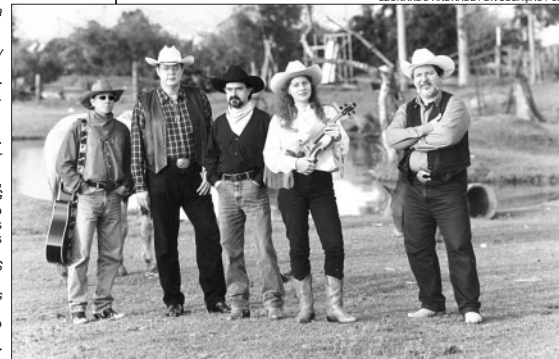
A The Travellers estará hoje em Gramado e, amanhã, em Salvador do Sul