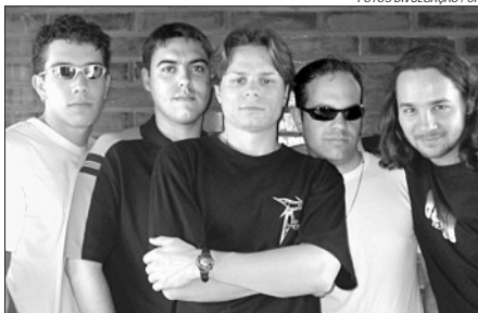
A banda Tripulante X mostra o melhor do pop e do rock