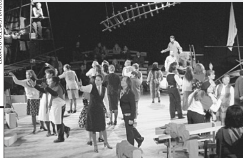
Expresso 25 se apresenta na Igreja São José neste domingo