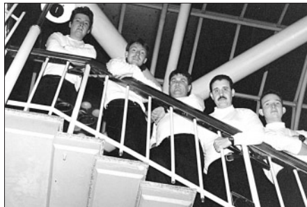
Nomes do mundo da música ao som da Reminders