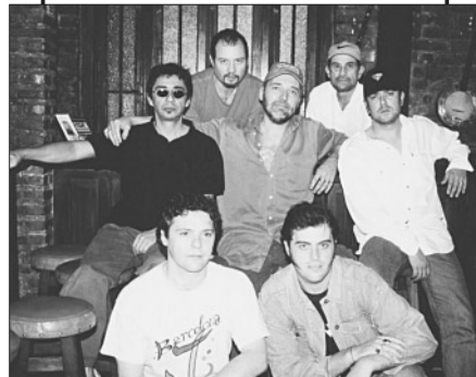
Corações Solitários no Sargent Peppers

Reconhecida como uma das mais importantes e melhores bandas da noite da Capital, a Banda dos Corações Solitários estará, mais uma vez, hoje, 22h, no Sargent Peppers (Dona Laura, 329). Com um repertório de primeira linha, a banda da casa apresenta músicas de Rolling Stones, Beatles, Bob Dylan e Eric Clapton, entre outros.