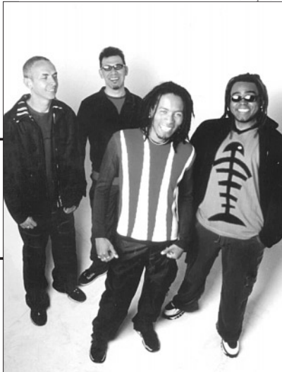
Papas da Língua mostram seus 10 anos de estrada