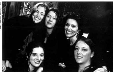
O D'Quina pra Lua se apresenta na Sala Álvaro Moreyra