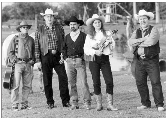
A The Travellers estará neste sábado, em Taquara, em encontro de motos

Depois de duas elogiadas apresentações, no Teatro do Sesi, na Capital, e no Hotel Laje de Pedra, no sábado passado, a banda The Travellers estará neste sábado, a partir das 20h, em Taquara. O show faz parte do encontro de motociclismo promovido pelo grupo Águias do Asfalto, e será no Parque da November Fest. A banda promete grande emoções com os clássicos do country-rock e da música internacional.