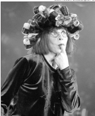
Rita Lee divide o palco na noite deste sábado

A série Encontros TIM tem sua estréia em Porto Alegre na noite de hoje, às 21h, no Salão de Atos da PUC-RS (Ipiranga, 6681). No palco, o inédito encontro entre a roqueira Rita Lee, Zélia Duncan e Wanderléia. Rita deve comandar o show, cantando seus sucessos presentes no "MTV ao vivo", com hits de sua carreira. Em seguida, a roqueira convida Zélia e Wanderléia para dividir canções das três cantoras.