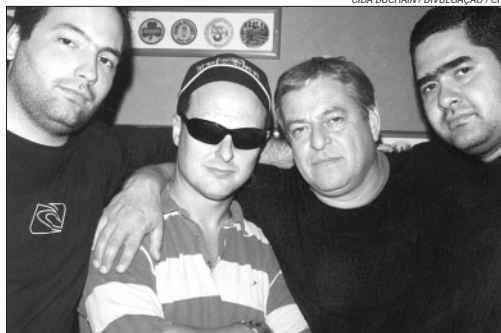
A Pussywater Pop Rock Blues Band estará lançando seu terceiro CD