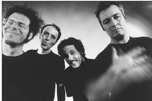
A banda Irmãos Rocha! é uma das atrações no Museu do Trabalho